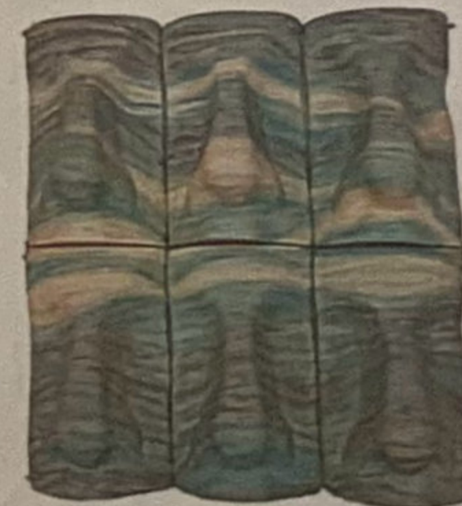
'OlasNAS' 2009 Acrílic i poliuretà