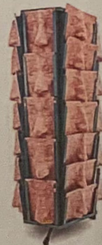
'NASDuchamp postales' 2005 Cartró i metall