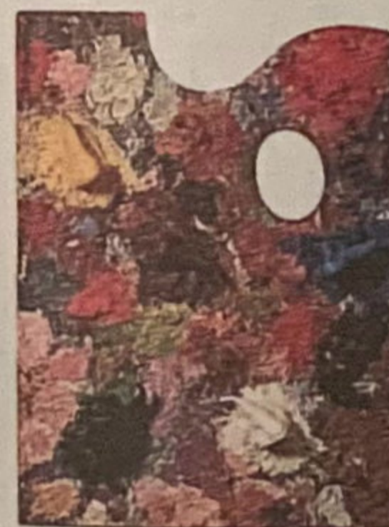
'PaletaNAS' 2008 Acrílic i poliuretà