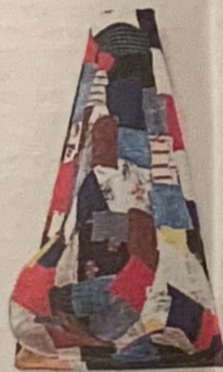
'MercadoNAS' 2003 Teixits i fibres