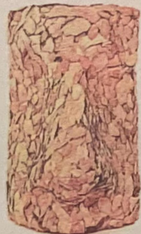
'Nascorcho' 2012 Suro