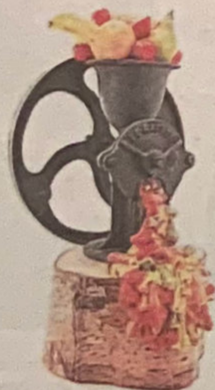
'NASrecuerdo' 2003/2004 Silicona i pintura acrílica